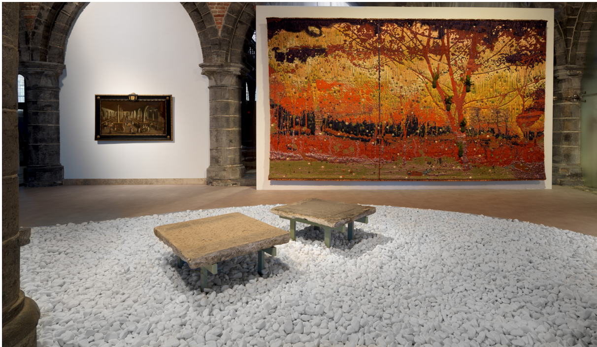
Otobong Nkanga, Unearthed – Sunlight, 2021, garens: trevira, sidero, polyester, multifilament, merinowol, superwash, linnen, mohair, econyl, vulgaren, elirex en viscose, 350 x 600 cm

Van Oosterwijk: "Beide wandtapijten zijn imponerende werken van 6 bij 3,5 meter met een bijzondere sensibiliteit, waarin Otobong Nkanga speelt met garens, volumes en texturen. Ze zijn gemaakt op basis van Nkanga's tekeningen en door het Nederlandse TextielLab in Tilburg geweven op een gloednieuw, imposant, innovatief, computergestuurd weefgetouw van maar liefst 3,5 meter breed dat complexe patronen en structuren aankan. Wij zijn dan ook verheugd dat we beide tapijten kunnen toevoegen aan onze collectie."