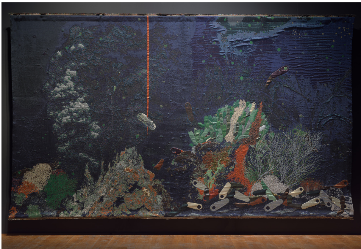
Otobong Nkanga, Unearthed – Abyss, 2021, garens: trevira, multifilament, polypropyleen voor buitengebruik, techno, elirex, mohair, monofilament, vulgaren, viscose, 350 x 600 cm