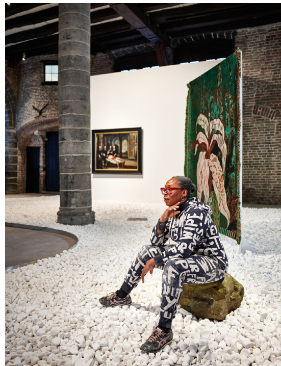
Otobong Nkanga - 'Underneath the Shade We Lay Grounded' (Sint-Janshospitaal)

Otobong Nkanga wordt wereldwijd beschouwd als een van de belangrijkste hedendaagse kunstenaars van het moment. Haar werk is internationaal tentoongesteld in ontelbare groepstentoonstellingen en verschillende belangrijke biënnales, waaronder die van São Paulo (2014) en Dakar (2016). In 2015 ontving ze de 8th Yanghyun Art Prize in het National Museum of Korea in Seoul (Zuid-Korea). In 2017 nam ze deel aan de 'Dokumenta 14' in Kassel en Athene en won ze dat jaar ook de Belgian Art Prize. In 2018 won ze de Vlaamse Ultima Cultuurprijs voor Beeldende Kunst.