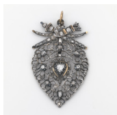
Zilveren hartvormige hanger, 1750-1800 Coll. Gruuthusemuseum Brugge