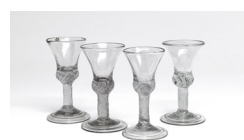
Set wijnglazen, 1775-1795 Coll. Gruuthusemuseum Brugge