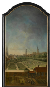
Jan Anton Garemijn? De tuin van de familie Willaey-Vleys in Groeninge, 1759 Coll. Groeningemuseum Brugge