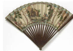
Waaier met Chinees landschap, 1725-1735 Coll. Gruuthusemuseum Brugge