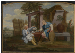
Anoniem, Zuidelijke Nederlanden? Chinoiserie, 18de eeuw Coll. Groeningemuseum Brugge Foto: Hugo Maertens

Afbeeldingen kunnen enkel voor promotionele doeleinden ten gunste van dit project gedownload worden op volgende link: http://www.flickr.com/photos/museabrugge/sets/ . Gelieve de correcte credits te vermelden