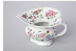
Hartvormige kwispedoor in 'famille rose'-patroon, 1735-1760 Coll. Gruuthusemuseum Brugge