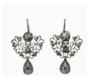
Oorbellen, 1750-1800 Coll. Gruuthusemuseum Brugge