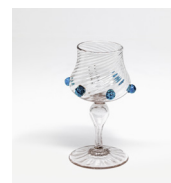
Wijnglas, 1750-1780 Coll. Gruuthusemuseum Brugge