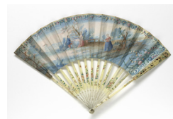
Waaier met pastoraal landschap, 1760-1800