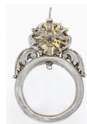
Trekkring van de Brugse Rederijkers-kamer van de H. Geest, 1726-1745