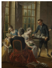
Jan Anton Garemijn Het vieruurtje, 1759/1778 Coll. Groeningemuseum Brugge