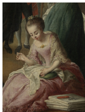
Jan Anton Garemijn Het vieruurtje, 1759/1778 Coll. Groeningemuseum Brugge