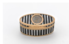
Snuifdoos met initialen, 1750-1800 Coll. Gruuthusemuseum Brugge