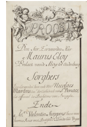
Register van de Confrérie van de H. Dorothea, 1651-1784