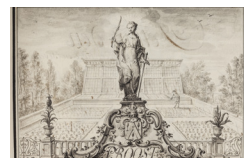
Register van de Confrérie van de H. Dorothea, 1651-1784