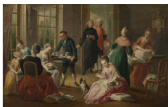
Jan Anton Garemijn Het vieruurtje, 1759/1778 Coll. Groeningemuseum Brugge